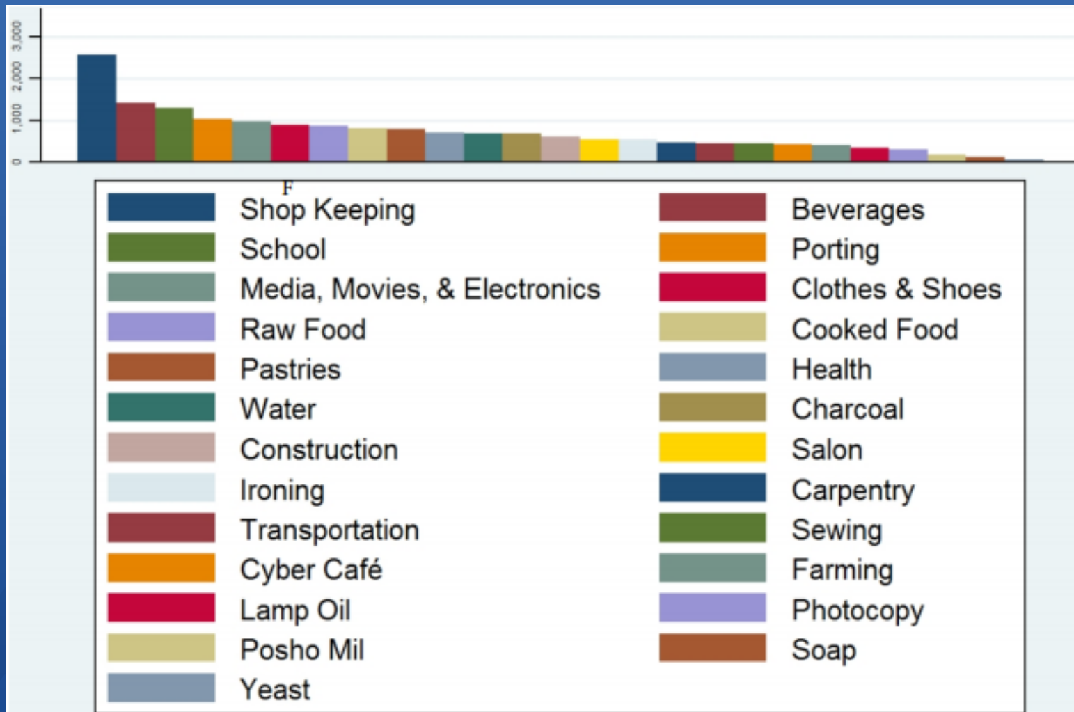
Figure 2: Average Sales by business type

...these businesses in the network could be doing even